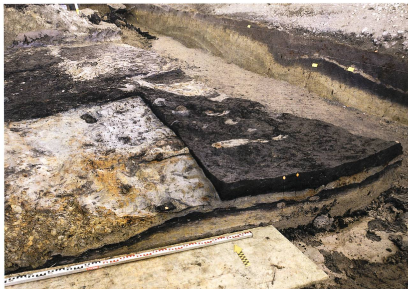
Abb. 3: Thun, Im Schoren 28. Eine schwarze Schicht zuunterst in der Grabung enthielt frühbronzezeitliche Keramik. Die feinen, lehmigen Sedimente belegen, dass das Gebiet damals im Einflussbereich des Sees lag.

Im Schoren 28 wurden 2019 erneut Siedlungsreste der ausgehenden Spätbronzezeit (9. Jh. v. Chr.) und eine Grube der älteren Eisenzeit untersucht (8.–6. Jh. v. Chr.; Abb. 2). Die Profile dieser Grabung zeigen, dass dieses Terrain in prähistorischer Zeit immer wieder überflutet wurde. Ganz am Ende der Untersuchung wurde eine Schicht angeschnitten, die frühbronzezeitliche Keramik enthielt (18./17. Jh. v. Chr.; Abb. 3). Damit kennen wir nun erstmals auch zeitgleiche Siedlungsreste zu den berühmten Thuner Gräbern der Frühbronzezeit.