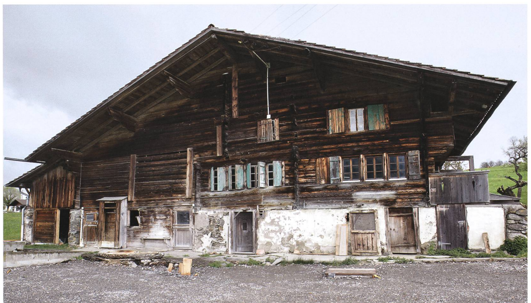
Abb. 1: Aeschi b. Spiez, Suldhaltenstrasse 31. Westfassade an der Suldhaltenstrasse, rechts der Wohnteil mit der 1779 ausgewechselten Wohnstube und links die seitlich angeordnete vergrösserte Ökonomie von 1849.

Die westliche Hauptfassade ist wenige Meter von der Suldhaltenstrasse zurückgesetzt. Der Wohnteil mit der über Eck angeordneten Wohnstube und der nördlich angrenzenden Nebenstube (Abb. 1, 2 und 4) ist in der Fassade heute durch jüngere grosse Reihenfenster,