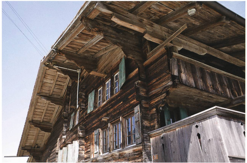
Abb. 2: Aeschi b. Spiez, Suldhaltenstrasse 31. Weit vorkragende profilierte Blockvorstösse tragen die Pfetten des Ursprungsbaus von 1559. Die Blockvorstösse vom 1779 erneuerten Stubengeschoss sind deutlich regelmässiger geschnitten als die vor die Fassade springenden Blöcke des Gadens von 1559 darüber. Durch regelmässiges Nachschlagen der vorstehenden Schliessbohlen konnte das durch Trocknung verursachte Schwinden der Holzböden ausgeglichen werden. Blick von Süden auf die Westfassade des Wohnteils.

Senkrechte Holzständer, sogenannte Mantelstüde, lassen erkennen, dass der Ökonomie teil nachträglich erneuert und vergrössert worden ist (Abb. 3, grün). Die Ständer befinden sich in den Stossbereichen der Blockhölzer zwischen Kern- und Neubau. Der wegen fehlender datierbarer Dendroproben nur durch eine Inschrift am Holzriegel des Tenntores in das Jahr 1849 datierte Umbau ist an der vom Weg abgewandten Ostfassade deutlich nachzuvollziehen. Der First des heutigen Daches in der Gebäudemitte stammt von diesem neuzeitlichen Umbau. Er ruht auf einem Holzständer und liegt etwas höher als der südlich davon erhaltene First des Kernbaus (rot). Letzterer liegt, wie beim alpinen Blockbau üblich, auf mächtigen Blockvorstössen. Der Kernbau dürfte etwa 4,5 m schmaler gewesen sein als der heutige Bau. Die Vergrösserung des Gebäudes im 19. Jahrhundert scheint auf eine Intensivierung der Viehwirtschaft und auf die im gesamten Alpenraum zu beobachtende zunehmende Praxis der Stallhaltung der Tiere zurückzuführen sein. Das auch auf der Rückseite weit vorspringende Satteldach des Kernbaus besass die gleiche flache Neigung wie