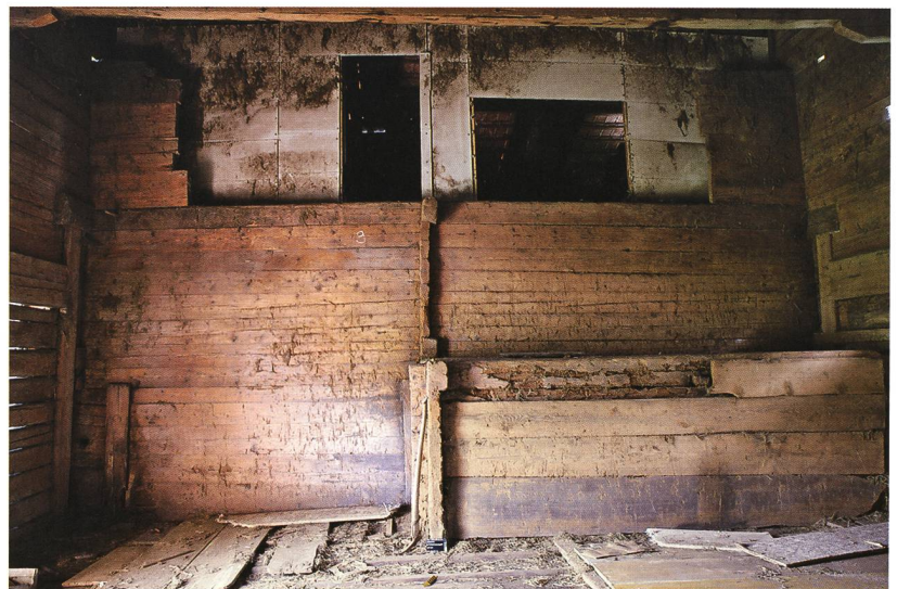
Abb. 7: Aeschi b. Spiez, Suldhaltenstrasse 31. Nordfassade des Wohnteils vom Heuboden aus gesehen. Die Blockkonstruktion der Nebenstube von 1779 springt in die Ökonomie vor. Darüber liegt die durchlaufende Blockwand zum Gaden des Ursprungsbaus von 1559. Hierauf ruhen wiederum die Enden der Blockvorstösse der 1849 neu angefügten grösseren Ökonomie.

Der spätbarocke Umbau des Wohnteils prägt heute das Bauernhaus. Von der ursprünglichen Fenstergliederung und den im Stubengeschoß schon damals anzunehmenden Zierelementen ist nichts mehr erhalten geblieben. Einzig die im Stil des 15./16. Jahrhunderts profilierten Enden der Pfetten stammen noch vom Bauschmuck des Ursprungsgebäudes.