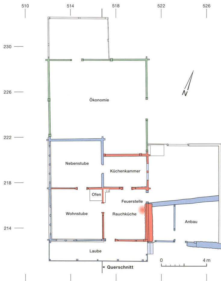
Abb. 4: Aeschi b. Spiez, Suldhaltenstrasse 31. Grundrissplan zum Erdgeschoss. Gut zu erkennen ist die 1779 vergrösserte Nebenstube, die nach Norden in die Ökonomie vorspringt. M. 1:200.

der heutigen Zugangslaube im Süden erst im 18. Jahrhunderts entstanden sein dürfte (Abb. 4, blau). Der unten näher beschriebene umfassende Umbau des Kernbaus fand in den Jahren ab 1779 statt. Damals waren offenbar auch auf der Höhe des Gadengeschosses in der Rauchküche Veränderungen geplant, die aber nicht ausgeführt wurden (Abb. 3, lila). Strichförmige Markierungen an den Innenseiten der dortigen