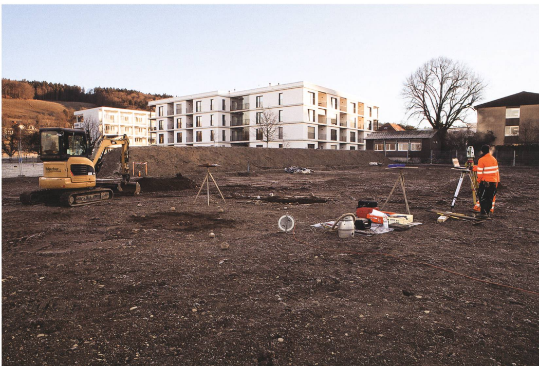
Abb. 1: Muri b. Bern, Allmendingenweg 3, 3a, 3b. Bei der Rettungsgrabung wurden nach Abtrag der oberen Bodenschichten auffällige Strukturen kleinflächig freigelegt, eingemessen und dokumentiert, bevor sie zur weiteren Untersuchung und Fundbergung mit dem Bagger geschnitten wurden. Blick nach Nordosten.

Im Grossteil der Fläche kam unter dem modernen Humus eine Deckschicht und darunter direkt verwittertes Material der Moräne zum Vorschein. In der Mitte der untersuchten Zone war zusätzlich ein alter Humus erhalten geblieben, welcher auch in den Untersuchungen von 2013 (s. u.) erkannt worden war. Dieser lag zwischen Deckschicht und verwitterter Moräne und bildete vermutlich ehemals die natürliche Oberfläche. Weiter wurden zahlreiche, verschiedenen grosse Gruben dokumentiert (Abb. 2). Die meisten reichten in ihrer Tiefe in das verwitterte Moränenmaterial, das sich von der darunterliegenden Grundmoräne abhob, und wurden von der verwitterten Deckschicht überdeckt. Einzig Grube 53 lag unter dem verwitterten Moränen-