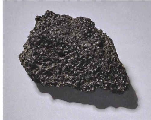
7 Studen, Rebenweg 23. Klumpen verbrannter Rispenhirse, der im Kanal gefunden wurde. M. 1:1.

Südlich des Kanals verlief eine 40 cm breite Mauer (Pos. 18; Abb. 3 und 4), die einst zu einem zwischen der Strasse und der Hangkante gelegenen Gebäude gehört haben muss. Einige gemörtelte Lagen waren nach Westen hin auf einer Länge von etwa 1,80 m sowie ostseitig nur noch fragmentarisch erhalten, im Bereich dazwischen war hingegen einzig deren Rollierung vorhanden (Abb. 5 und 6). Die schmale Mauer und die geringe Tiefe der Rollierung (knapp 30 cm) sprechen für ein Balkenlager oder ein Sockelfundament für ein Holzgebäude. Ebenso könnte die Mauer als Unterbau für eine Wand aus Lehm- und Holzfachwerk oder als Auflage für eine porticus (Säulengang) gedient haben. Da in der untersuchten Fläche von 1991 keine Gebäudereste zum Vorschein gekommen sind und der östliche Abschluss unter dem Gebäude am Rebenweg 23 liegen müsste, ergaben sich keine Anhaltspunkte für die Ausdehnung des Hauses. Weder Befund noch Funde liefern einen Hinweis darauf, welchem Gewerbe oder Zweck dieses beim östlichen Ortseingang an der Strasse gelegene Gebäude gedient hatte.