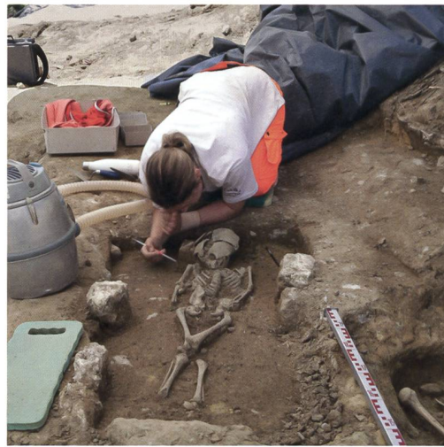
3 Lyss, Hutti 27. Eine Mitarbeiterin des Archäologischen Dienstes beim Freilegen des Kindergrabes Pos. 4. Auf der Grabsohle wie auch in der Hinterfüllung der Grabgrube wurden römische Wandverputzfragmente (weissgraue Einschüsse) geborgen.

Die meisten geosteten Bestattungen lagen nicht genau in der erwähnten Himmelsrichtung, sondern mit dem Blick nach Nordos-