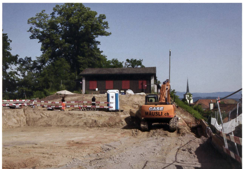
4 Lyss, Hutti 27. Grabungssituation am Südrand des Kirchhubels. Rechts ist der Kirchturm der neuen reformierten Kirche von Lyss zu sehen. Blick nach Norden.

Unterschiede bei der Grabkonstruktion zeigten sich in der Grösse und Form der Grabgruben, in der Wahl der verwendeten Materialien für die Einfassung sowie in der Lage der Skelette. In den Gräbern Pos. 4 und 60 lagen einzelne Steine, die mehr oder weniger eine Linie bildeten. Die drei Gräber Pos. 4, 40 und 60, mit Wandverputzstücken in der Verfüllung, hatten