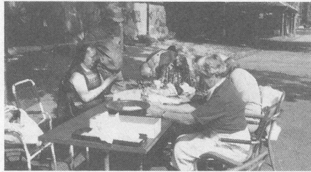
Puppenkurs im Treffpunkt Kaserne

Anmeldung bis 15. Juni an Pro Senectute, Tel. 23 30 71 Montag–Freitag 8.00–11.30 h