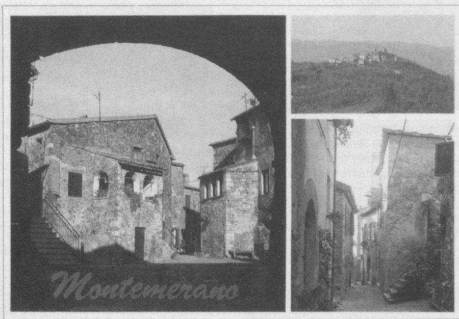
Die typisch idyllischen Gässchen der Toskana.

Unser Standort ist Montemerano , ein reizendes Hügelstädtchen in der Südtoskana, abseits des Touristenstroms. Dort logieren wir in gut eingerichteten Wohnungen (1–2 Personen).