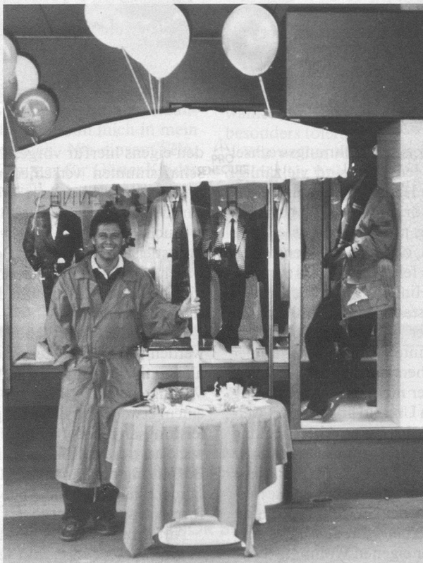
Einer unserer Informationsstände am Sammeltag in der Freien Strasse.