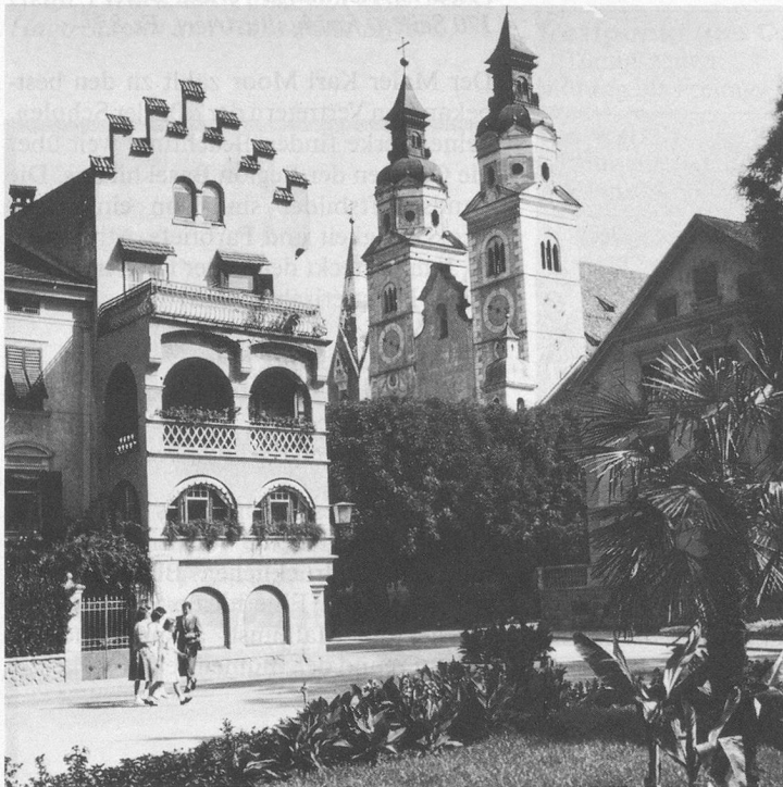
Brixen mit dem berühmten Dom.