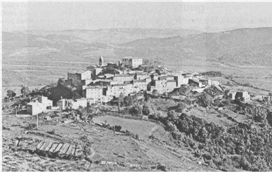
Saturnia, das malerische Dorf inmitten der Toskaner Hügel.

Der Standort ist SATURNIA , im Herzen der Toskana (Maremma) auf einer Anhöhe gelegen. Das ruhige Dorf, weg vom Touristenstrom, ist ein idealer Ausgangspunkt für Ausflüge nach den bekannten Etruskerstädten, wie Castel d'Asso, Tarquinia, Tuscania, Siena usw. Das Albergo Saturnia , wo wir logieren, hat einfache, saubere Zimmer mit Dusche/WC und verfügt über eine ausgezeichnete toskanische Küche.