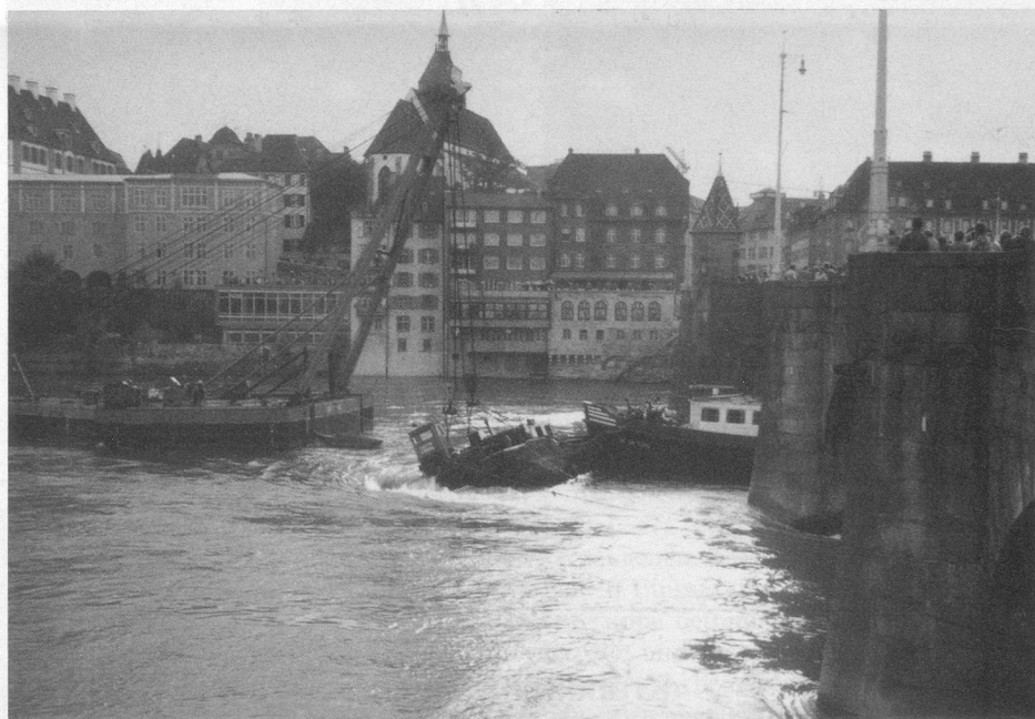
Im Herbst 1984 kennerte die «Corona» vor der mittleren Rheinbrücke.

Mein Basel! – Ich bin in Basel geboren, im Schatten der Münstertürme aufgewachsen und habe mich immer für alles, was mit Basel zusammenhängt, interessiert; doch mein Basel? Je länger ich mir zu diesem Titel Gedanken gemacht habe, desto schwieriger schien es mir, dazu etwas Ehrliches zu schreiben. Denn was macht Basel eigentlich baslerisch? Ist es, wie Jacob Burckhardt schrieb, die Mischung aus dem Geist der Fasnacht und des Totentanzes? Die «Chemie», der von der Bevölkerung gekaufte Picasso? Das Münster? Auch Strassburg hat eines, und der Rhein fliesst schliesslich bis nach Rotterdam. Oder ist es am Ende unser Hang zur Nabelschau, der uns, wenigstens in unseren eigenen Augen, so einzigartig werden lässt und dabei manches Grossartige an unserer Stadt, da scheinbar «unbaslerisch», gar nicht wahrnehmen lässt? Je mehr man mit seiner Stadt verwachsen ist, je zärtlicher man für sie empfindet, desto schwieriger wird es auch, den Mittelweg zwischen feurig-verklärter Liebeserklärung und kategorischem Kritiklastertum zu finden. Wenn man etwas von allzu nahe betrachtet, beginnt es vor den Augen zu flimmern. In der «fernen Fremde» jedoch kommen Erinnerungen auf. Erinnerungen, die Vertrautheit wecken und uns Geborgenheit geben, weil wir uns durch sie in ein grösseres Ganzes eingebunden wissen. Und die sind dann wohl auch mein, mein ganz persönliches Basel. Menschen, denen ich ver-