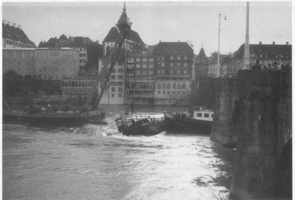
Im Herbst 1984 kennerte die «Corona» vor der mittleren Rheinbrücke.

Mein Basel! – Ich bin in Basel geboren, im Schatten der Münstertürme aufgewachsen und habe mich immer für alles, was mit Basel zusammenhängt, interessiert; doch mein Basel? Je länger ich mir zu diesem Titel Gedanken gemacht habe, desto schwieriger schien es mir, dazu etwas Ehrliches zu schreiben. Denn was macht Basel eigentlich baslerisch? Ist es, wie Jacob Burckhardt schrieb, die Mischung aus dem Geist der Fasnacht und des Totentanzes? Die «Chemie», der von der Bevölkerung gekaufte Picasso? Das Münster? Auch Strassburg hat eines, und der Rhein fliesst schliesslich bis nach Rotterdam. Oder ist es am Ende unser Hang zur Nabelschau, der uns, wenigstens in unseren eigenen Augen, so einzigartig werden lässt und dabei manches Grossartige an unserer Stadt, da scheinbar «unbaslerisch», gar nicht wahrnehmen lässt? Je mehr man mit seiner Stadt verwachsen ist, je zärtlicher man für sie empfindet, desto schwieriger wird es auch, den Mittelweg zwischen feurig-verklärter Liebeserklärung und kategorischem Kritiklastertum zu finden. Wenn man etwas von allzu nahe betrachtet, beginnt es vor den Augen zu flimmern. In der «fernen Fremde» jedoch kommen Erinnerungen auf. Erinnerungen, die Vertrautheit wecken und uns Geborgenheit geben, weil wir uns durch sie in ein grösseres Ganzes eingebunden wissen. Und die sind dann wohl auch mein, mein ganz persönliches Basel. Menschen, denen ich ver-