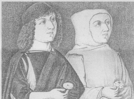
Hieronymus Zscheckenbürlin als Lebeamant und als letzter Prior des Kartäuserklosters