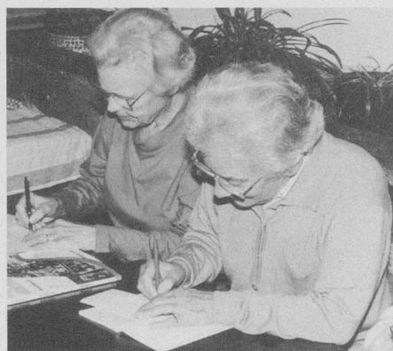
Gemeinsam lernen macht uns Freude.

Interessentinnen und Interessenten melden sich bitte unter: Telefon 272 30 71 (08.00 – 11.30 Uhr)