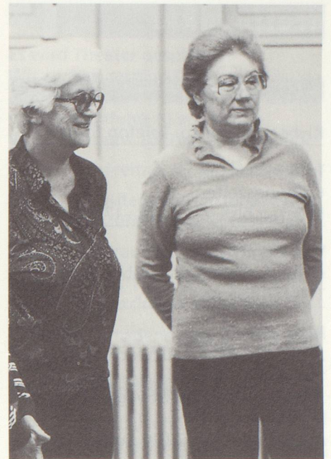
Bewegung und Gemeinschaft – auch zuzuschauen gehört dazu