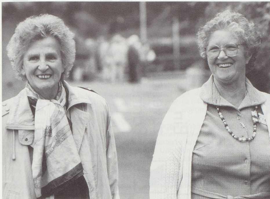
Das war ein schöner Ausflug