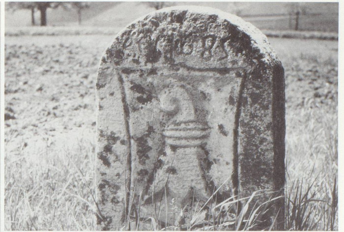
▲ Grenzstein im Baselbiet – Maisprach