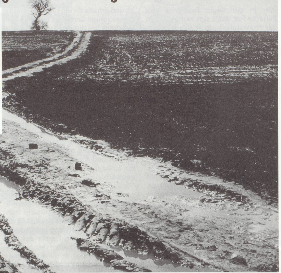
▲ Pfade für Kenner

Wer kennt sie nicht, die stimmungsvollen Landschaftsaufnahmen des Basler Fotografen Ludwig Bernauer, die regelmässig in der Basler Zeitung veröffentlicht werden? Den Akzént-Lesern zeigt Ludwig Bernauer eine kleine Auslese von seinen unzähligen Impressionen, die er bei seinen fotografischen Streifzügen durch die Regio festgehalten hat. Für die stimmungsvollen Jura- und Sundgauerlandschaften sprechen für sich. Lassen Sie die Bilder auf sich einwirken.