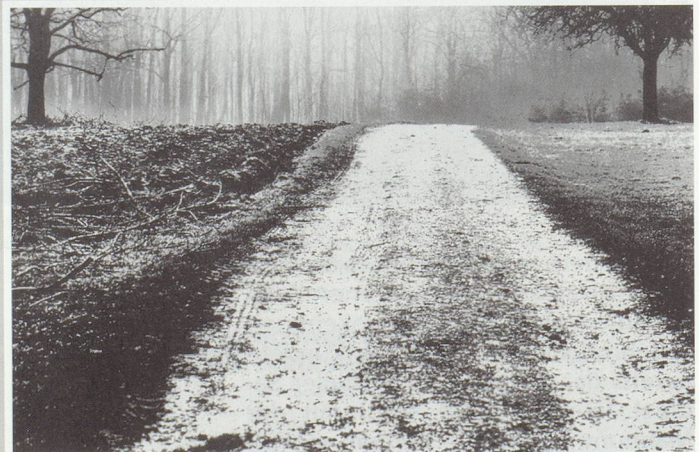
▼ Bruderholzweg ohne Kosmetik