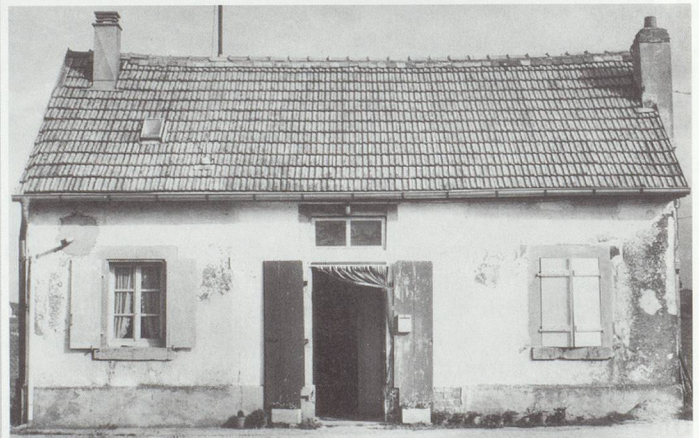
▲ Kanalhäuschen – Rhein/Rhône-Kanal