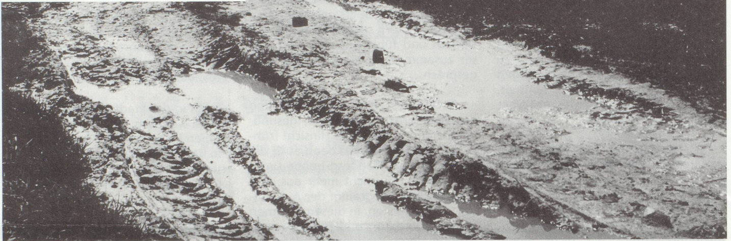
▼ Birsschlucht bei Münchenstein