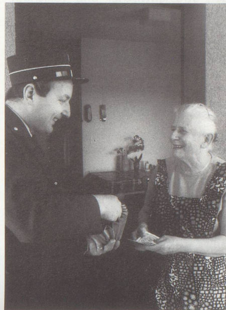
8000 Rentnerinnen und Rentner sind in Basel auf Ergänzungsleistungen und Beihilfen angewiesen.