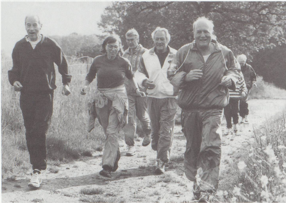
Die Pensionierung... mein nächster Schritt

Die Pensionierung wird heute ein zunehmend bedeutenderes Lebensereignis. So hat ein 60jähriger Mann noch durchschnittlich 20 Jahre seines und eine 60jährige Frau durchschnittlich 25 Jahre ihres Lebens vor sich. Wenn wir die Situation in Industrie und Wirtschaft näher betrachten, stellen wir zudem fest, dass es – vor allem in den Grossbetrieben – immer mehr zum Ausnahmefall wird, wenn eine Arbeitnehmerin oder ein Arbeitnehmer zum gesetzlichen Zeitpunkt von 62, resp. 65 Jahren pensioniert wird. Die Pensionierungsgrenze sinkt nicht selten auf 58 Jahre, und dies bei steigender durchschnittlicher Lebenserwartung. Das sogenannte dritte Lebensalter ist also zahlenmässig je länger je stärker vertreten. Dies macht aber vielen Betroffenen gefühlsmässig zu schaffen. Lassen Sie mich hierzu etwas ausholen. Im 13. Jahrhundert, also zur Gründerzeit der Eidgenossenschaft, kannte man noch keine Pensionierung. Die damalige Lebenserwartung lag bei durchschnittlich 35 Jahren, die Menschen – vorwiegend Bauern – zogen sich erst von der Arbeit zurück, wenn ihre körperlichen Fähigkeiten nachliessen. Die wenige Zeit bis zu ihrem Tode verbrachten sie dann in der Familie, übernahmen im Haus und Garten diejenigen Arbeiten, welche ihre Kräfte zuließen. Sie hatten also immer noch einen «Wert» für die Familie und nicht zuletzt auch für sich selbst. Sie wurden im Gegenzug von der Familie betreut und versorgt. Erst durch die Industrialisierung änderte sich allmäh-