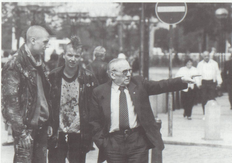
Ohne Toleranz und Solidarität zwischen Jung und Alt kein Generationenvertrag