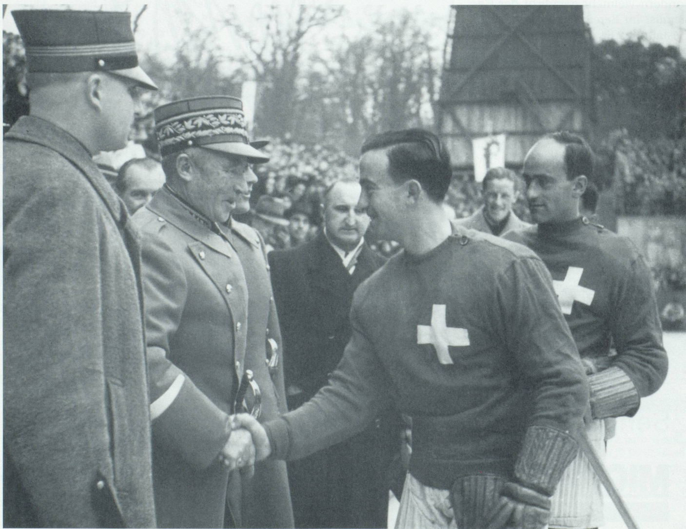
General Guisan begrüsst die Schweizer Nationalmannschaft auf der Basler Kunsteisbahn.