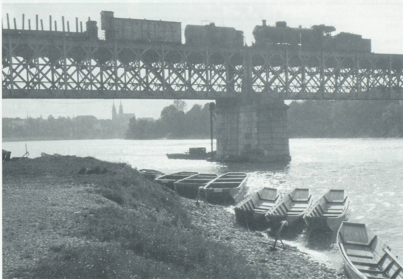
Die alte Eisenbahnbrücke.