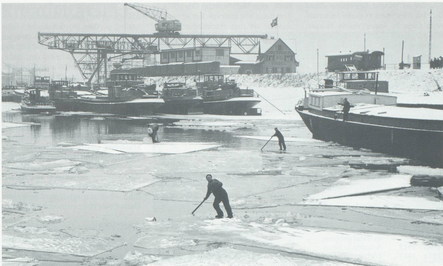
Der Rheinhafen im Winter.