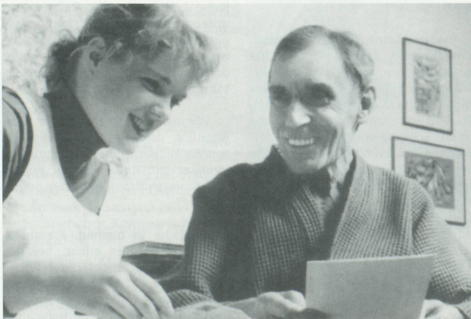
Nach wie vor ist die Pflege alter Menschen Frauensache

Also ohne falsche Komplimente, aber das machen Sie. Allein, wenn ich Ihr vielfältiges Kursangebot anschau. Sie bieten, ich sage es jetzt ein wenig abschätzig, nicht einfach Freizeitbeschäftigung an, sondern zum Teil sehr anspruchsvolle Kurse. Menschen, die auch im Alter ihre Interessen pflegen, sind nämlich wirklich spannende und aktive Gesprächspartner. Deshalb kann die Aufgabe von Pro Senectute nicht hoch genug geschätzt werden. Sie nehmen die Leute ernst, indem Sie ihnen vielleicht auch etwas abfordern.