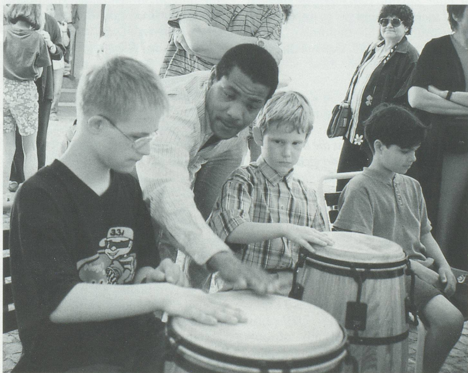
Kinder im Museum

Nein, ich habe, soweit ich mich erinnern kann, als Kind nicht gesammelt. Für mich steht das Vermitteln im Vordergrund, wobei ich absolut nicht der Meinung bin, dass man die anderen bei-