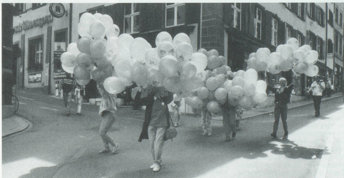
Frauen gehen auf die Strasse...

Dem ersten offiziellen Zusammenschluss der Frauen zur FBB (Frauenbefreiungsbewegung) 1969 in Zürich folgten bald Gründungen in den grösseren Schweizer Städten, so auch in Basel. Ohne Beziehung zu den politischen Organisationen, nur vereinzelt in Kontakt mit Frauen aus den traditionellen Frauenorganisationen, verschaffte sich die neue Frauenbewegung trotzdem öffentliche Aufmerksamkeit. Ihr Mittel: die bewusste Provokation: Als im März