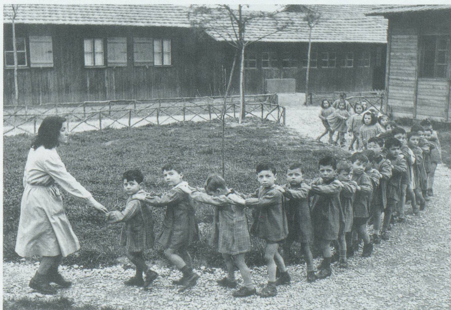
Ausländerkinder in einem Auffanglager in der Schweiz, 1944.

Geschichte der Schweiz und der Schweizer , Helbing & Lichtenhahn Verlag AG, Basel, 1983