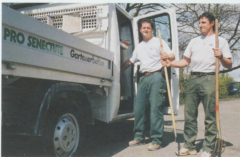
Die Gärtner von Pro Senectute Basel-Stadt kümmern sich um Ihren Garten!

Wir freuen uns über Ihren Anruf und danken Ihnen für das Vertrauen, welches Sie Pro Senectute Basel-Stadt entgegenbringen!