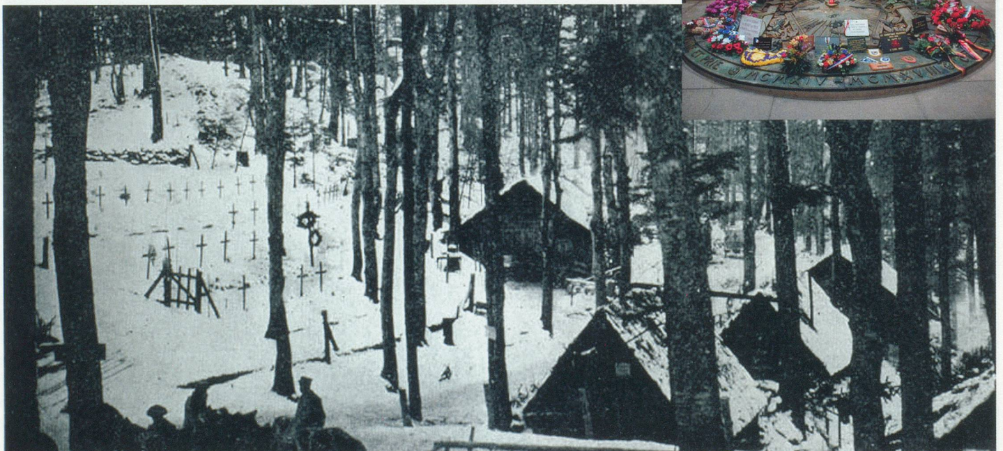
Soldatengräber am Hartmannsweilerkopf – damals und heute