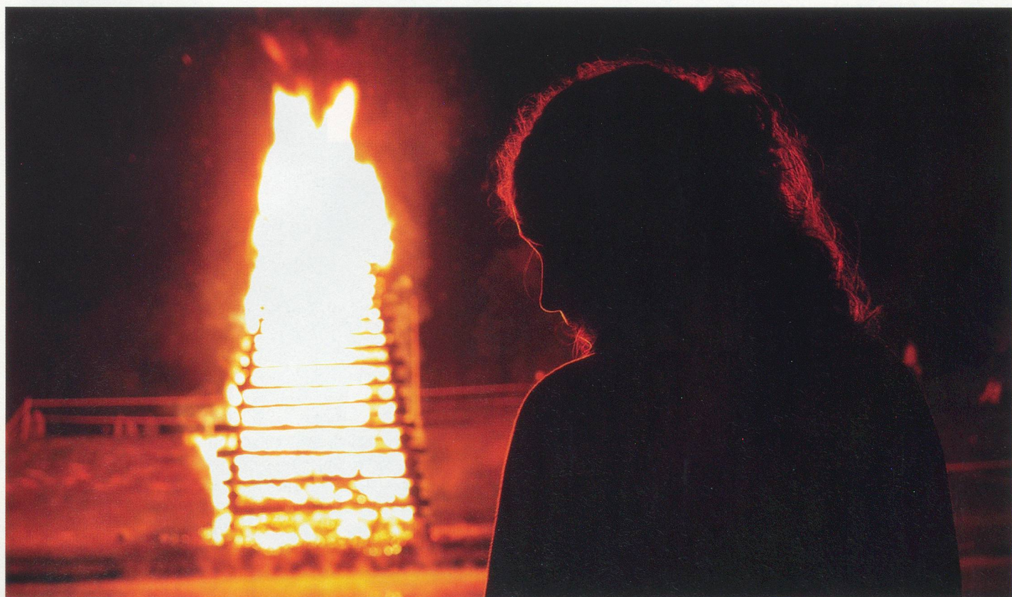
Johannisfeuer in Ensisheim

Ethnologen und Volkskundler meinen zu wissen, worum es geht. Unter der Firnis christlicher Gläubigkeit hat sich altheidnisches Vorstellungsgut erhalten, wie es bevorzugt das Brauchtum zu Wendezeiten, an Neujahr, aber auch bei Geburt, Hochzeit und Tod etwa, die vermeintlich kritische Übergangszustände darstellen, umlagert. Ist es nun lebendige Tradition, tief verwurzelt in alten Riten und Bräuchen? Oder aber sinnentleerte Handlung, welcher eine Spur von Aberglauben anhaftet? Dieses Dilemma stellt sich jeder Gesellschaft wieder von neuem, und jede findet darauf ihre eigenen Antworten. Alles könnte anders sein, und nichts kann sich ändern – so hat Niklas Luhmann einmal die Befindlichkeit des modernen Menschen charakterisiert. Alles könnte an-