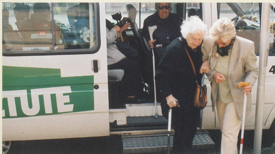
Wir fahren behinderte Betagte in den Treffpunkt Kaserne.

Wir freuen uns auf Ihren Besuch. Schauen Sie einfach herein, eine Anmeldung ist nicht nötig.