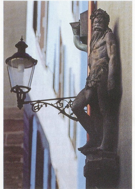
Holzplastik des ehem. Gasthofs «Zum Wilden Mann»

Nun könnte es man bei diesem Kleinbasler Ehrentag belassen und ihn, volkskundlich gesehen in die vorreformatorische Zeit des Mittelalters ansiedeln. Oder aber wir nehmen den Faden noch einmal auf und spinnen ihn, quasi rückwärts, in tiefere Schichten unserer Vorzeit, begeben uns auf den Weg in den wilden Wald.