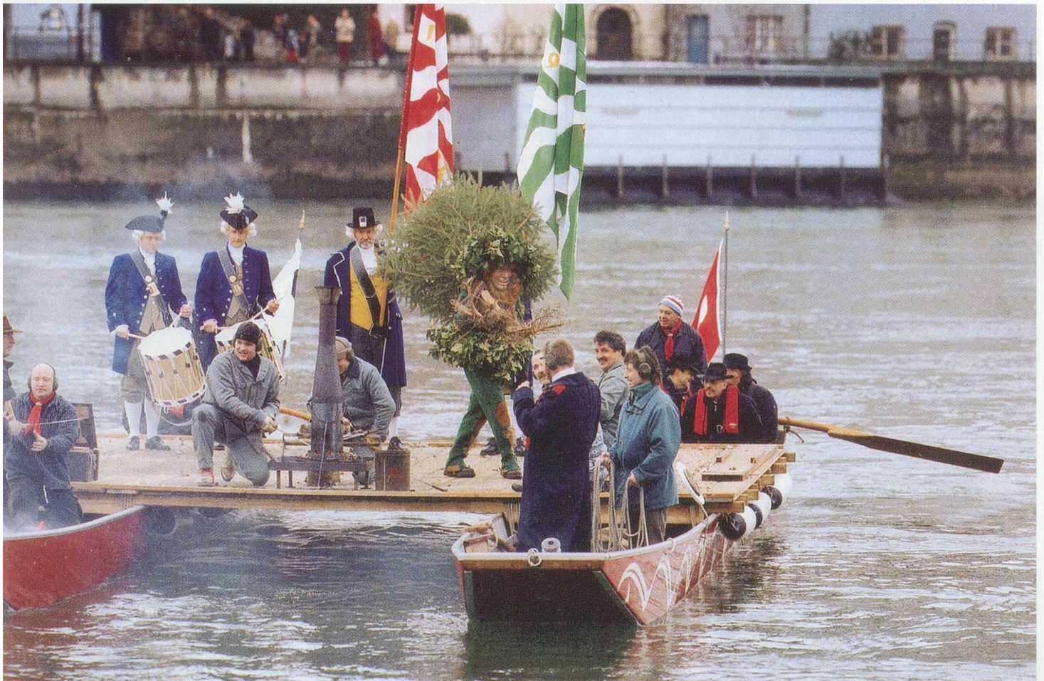
Das Wild Maa-Floss bei der Landung beim Kleinen Klingental

In die Unwirtlichkeit des Waldes drangen Menschen nur ausnahmsweise vor, vielleicht um ein angeschossenes Wild zu verfolgen. Wo die vom Menschen genutzte Waldzone zu Ende ging, begann eine andere Welt, die den wilden Tieren, den Ungeheuern, Dämonen und Gespenstern gehörte – dort hatte der Mensch nichts verloren. Hinter der Hecke hausten nicht nur Bär, Wolf, Luchs und Uhu – für den mittelalterlichen Menschen war der Wald auch von guten und bösen Geistern bewohnt, von armen Seelen und Hexen, Hagezusen, wie man sie nannte, Frauen also, die beidseits der Hecke lebten. Der Wald war unheimlich und voller dunkler Geheimnisse und, wenn immer möglich, hielt man sich fern von ihm. Wildmännern und Wildfrauen trieben dort ihr Unwesen, fügten den Menschen Schaden zu oder – noch viel schlimmer – verführten sie mit ihren Zaubersprüchen und Verwandlungskünsten zu unsittlichen Handlungen.