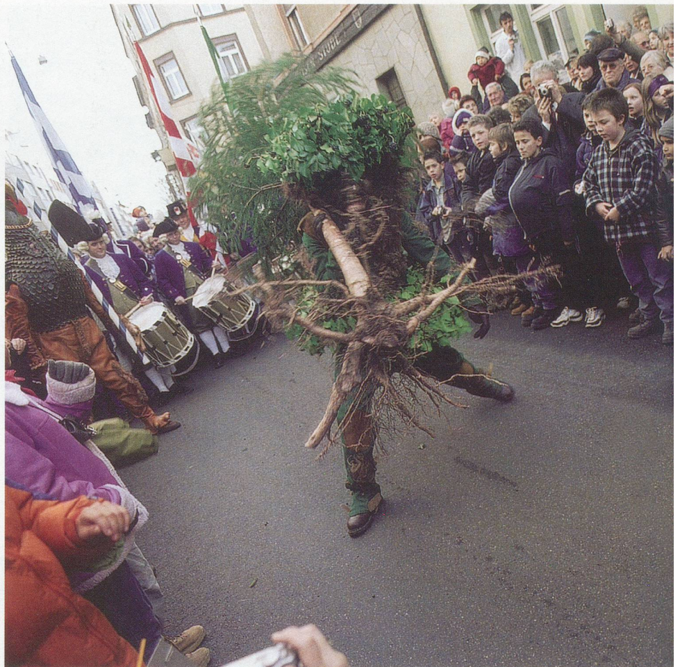
Der Wild Maa tanzt im Zickzack zum Trommelschlag