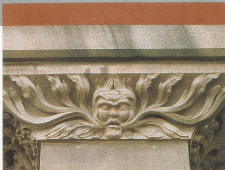
Grüner Mann als Vegetationsheros am Basler Münster