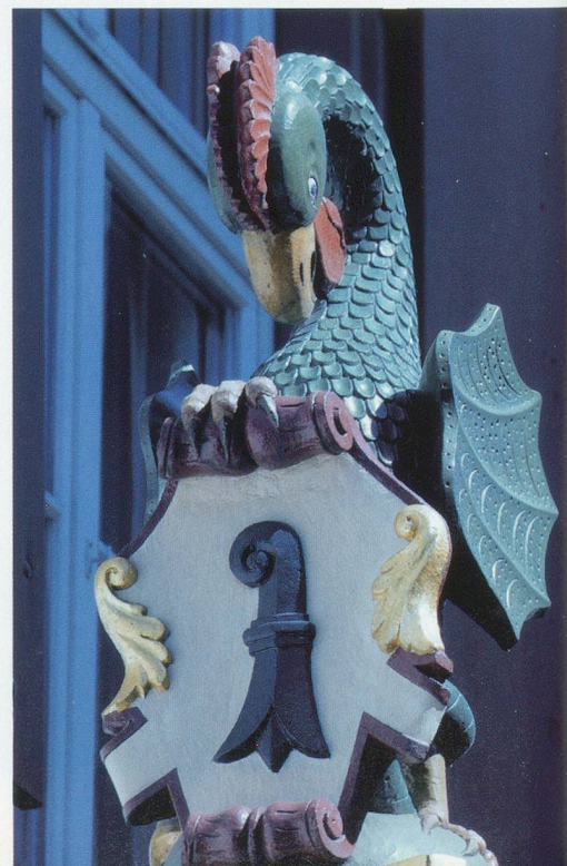
... auf dem Brunnen in der Augustinergasse