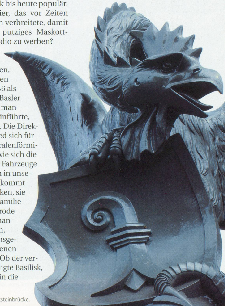
... und bei der Wettsteinbrücke.

Kreis Georg, von Wartburg Beat, Basel – Geschichte einer städtischen Gesellschaft , CMS Verlag, Basel, 2000