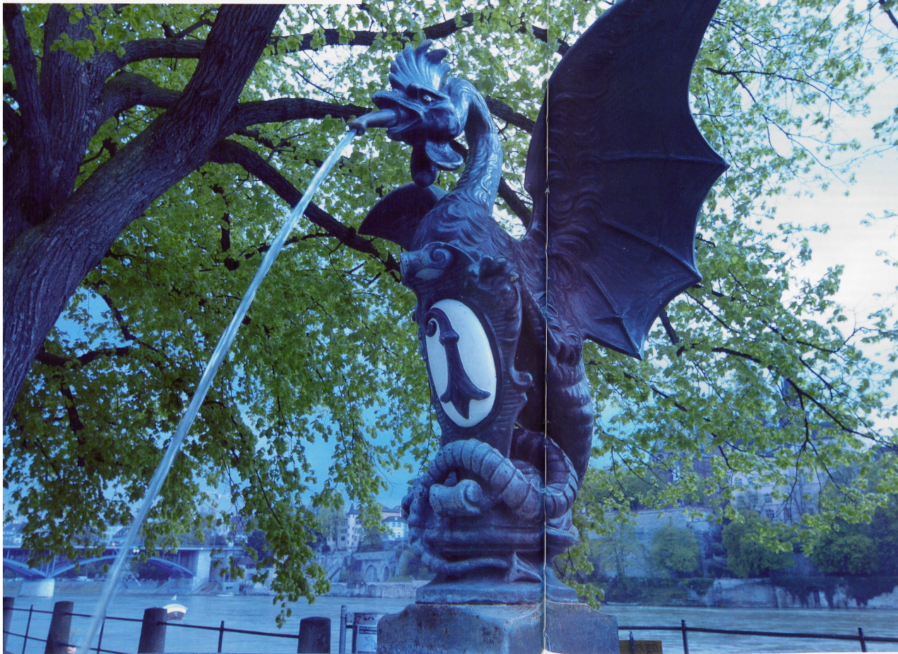
Der Basilisk auf den öffentlichen Serienbrunnen ...

Seit Urzeiten soll er im Gerberloch hausen und dort einen Schatz horten. Von den Baslern als einen der ihren aufgenommen wurde er aber erst im 15. Jahrhundert. Dann allerdings übergab man ihm gleich das Ehrenamt eines Wappenschildhalters. Die Rede ist vom Basilisken, dem Untier mit Hahnenkopf, Flügeln und Drachenschwanz. Die Faszination, die von ihm ausgeht, ist bis heute ungebrochen.