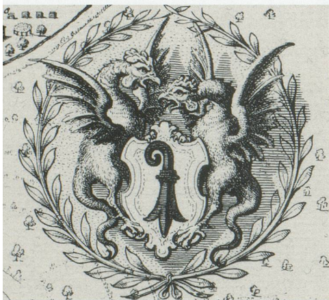
... auf einem Stadtplan von Mathäus Merian ...

Plinius d.Ä., ein römischer Historiker, der seine wissenschaftliche Neugierde bei der Beobachtung des Vesuvausbruchs 79 n. Chr. mit dem Leben bezahlte, hinterliess der Nachwelt eine 37