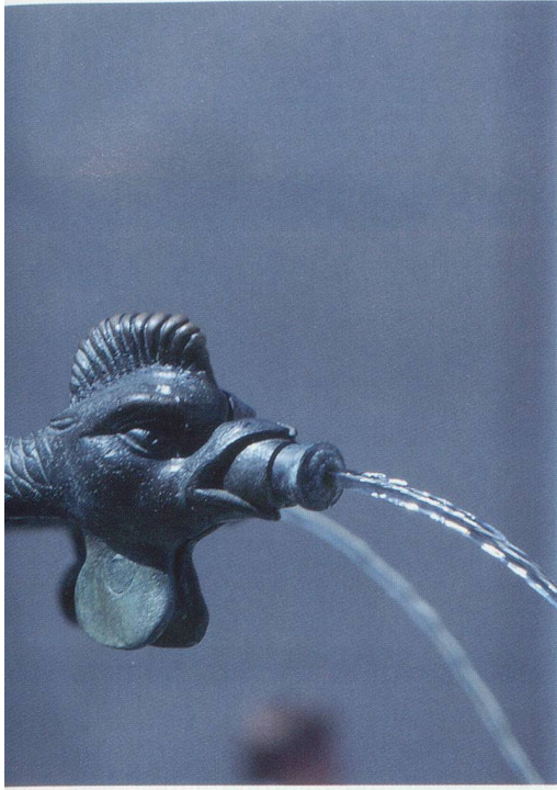
... am Münsterberg-Brunnen ...

und Stadtschreiber, dem die erste umfassende Basler Geschichte zu verdanken ist, lehnte einen Zusammenhang zwischen den Begriffen Basilea mit dem Basilisco, dem Giftwurm, als Märlein ab. In der Tat streiten sich die Gelehrten nach wie vor über die Herkunft des Wortes Basel, die im Dunkeln liegt.