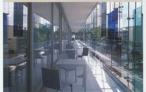
Diener & Diener