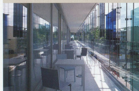
Diener & Diener