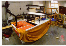
Bildlegende Bild oben, Mitte und unten links: Atelier Tarek Mousalli, Basel Bild unten Mitte: Barbara Club, Basel