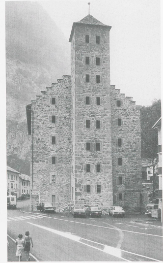
Stockalpers Suste in Gondo, erbaut 1670. Der mächtige fünfgeschossige Bau mit dem im Osten vorgelagerte Frontturm diente als Herberge und als Lagergebäude für den Warentransport über den Simplon.

Am 29. April 1691 stirbt Kaspar Jodok Stockalper. Knapp dreihundert Jahre später, 1975, erloscht auch sein Geschlecht im Mannesstamme. Das riesige Vermögen ist zerronnen. Geblieben sind seine Stiftungen und vor allem sein Schloss mit den drei stolzen Türmen, der Stockalperpalast in Brig, das er «Sonne» nannte.