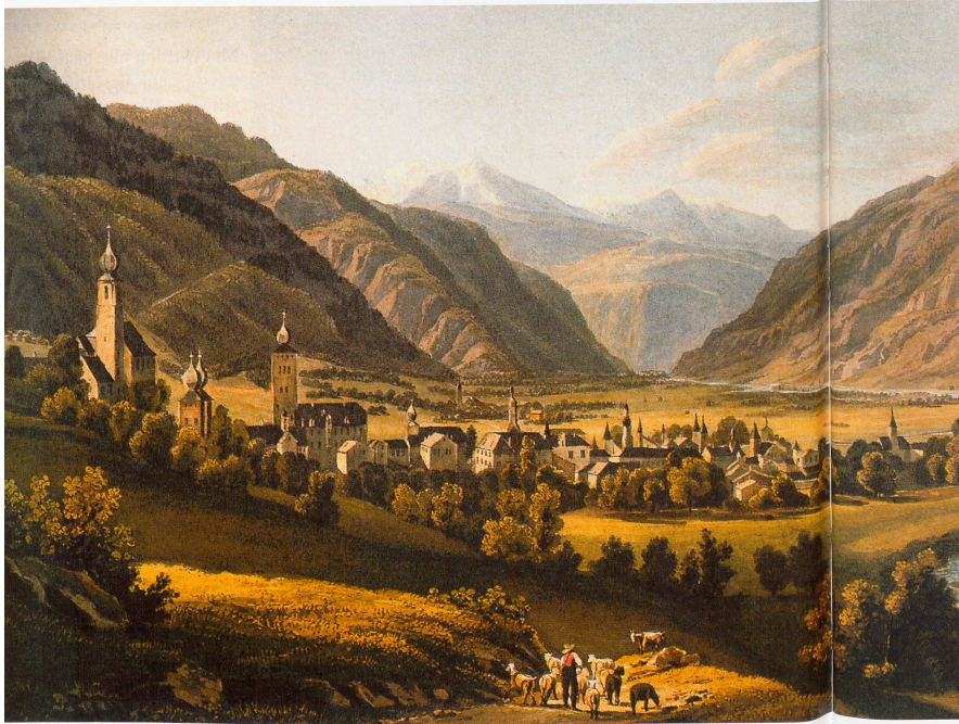
Ostansicht des Städtchens Brig, im Hintergrund Glis und Visp. Links die Kollegiumskirche und das Stockalperschloss. Aquareinta aus Jean-B.-B. Sauvan, Le Rhône, Paris 1829.

die Landschaft Wallis ihm ... hunderttausend und einhundert Dublonen genommen habe.» Und als sein Feind In-Albon, der 1682 im Sterben liegt, einen Jesuiten zu ihm schickt, um ihn um Verzeihung zu bitten, lässt er ausrichten: «Bette er erst gott und Maria um verzeihung; gibt er mir wieder, was er mir gestolen, so hab ich ihm verzogen.»