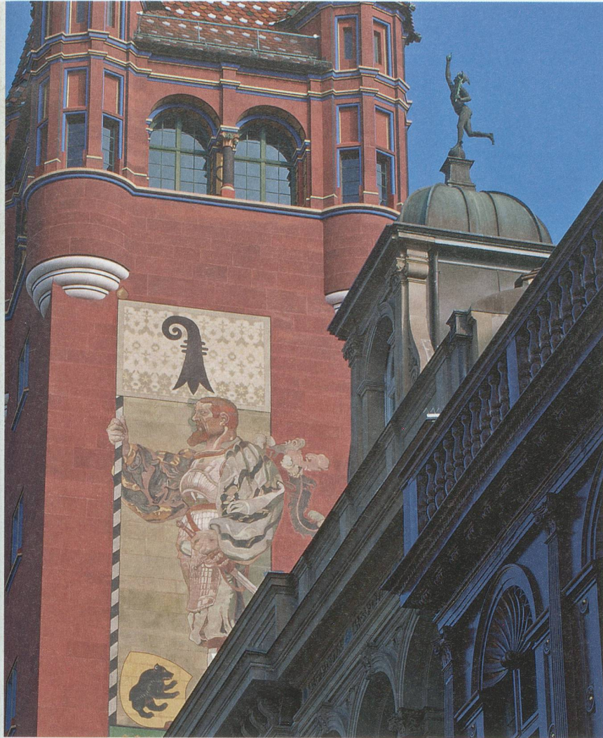
1501: Bundesschwur auf dem Kornmarkt