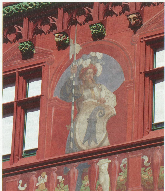
Fresko am Basler Rathaus

Seit dem 11. Jahrhundert war Basel, das unter der Herrschaft des Bischofs stand, Teil des Heiligen Römischen Reichs Deutscher Nation. Ursprünglich war die Stadt umgeben von zahlreichen Adelherrschaften, deren Besitz im heutigen Baselbiet ab dem 14. Jahrhundert nach und nach von reichen Bürgern, später von der Stadt selber aufgekauft wurden. Gleichzeitig gelang es der städtischen Obrigkeit, vom ständig verschuldeten Fürstbischof zahlreiche Herrschaftsrechte zu erwerben und sich so, voreerst