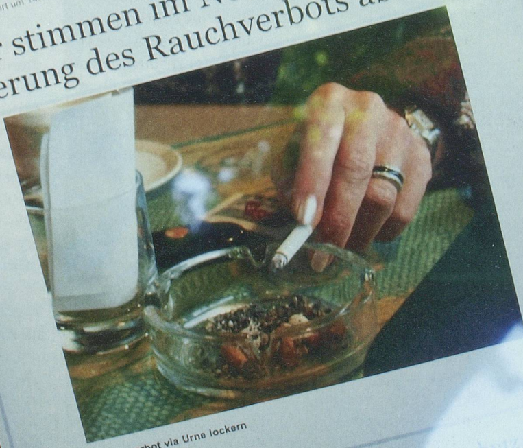
Wirtе wollen Rauchverbot via Urne lockern

Über die Initiative «Ja zu einem Nichtrauchererschutz ohne kantonale Sonderregelung» wird am 27. November abgestimmt. Die Regierung hat diesen Termin am Dienstag beschlossen. Mit dem Begehren will der Wirterverband das