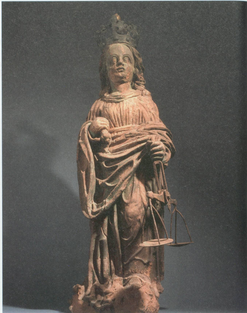
Justitia aus dem Historischen Museum Basel

zu denen auch die «Carolina» gehörte, die über ihre unmittelbare Anwendung in der frühen Neuzeit hinaus gewirkt hat.