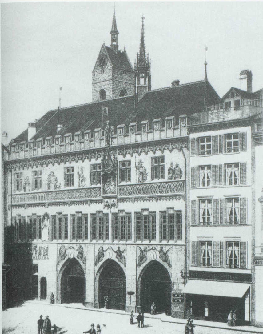
Als das Rathaus noch Richthaus war

ges Recht beibehalten durften und die «Carolina» nur subsidiär, also hilfsweise galt.