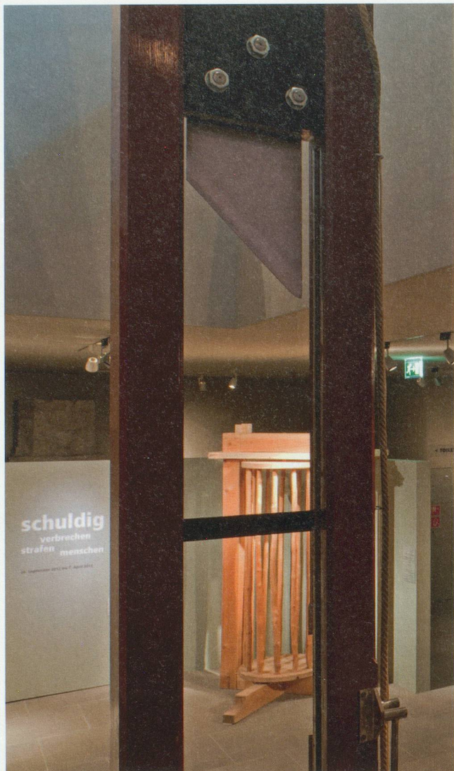
Die Guillotine war letztes mal 1940 in der Schweiz im Einsatz (Obwalden)