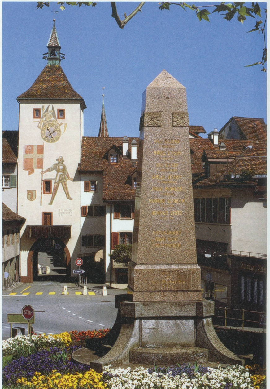
Denkmal in Liestal zur Erinnerung an den Bauernkrieg

Alle Urteile konnten jedoch nicht vollzogen werden. Mehrere zu Galeerenstrafen verurteilte Untertanen wurden während ihrer Überführung bei Rheinfelden von einer aufgebrachten Menschenmenge befreit. Sie stellten sich der Basler Obrigkeit und erhielten nun mildere Strafen. Für die sieben zum Tode Verurteilten gab es dagegen keine Wendung zum Besseren. Auf ihrem letzten Weg zur Richtstätte wurden sie der Bevölkerung vorgeführt, bevor sie «auff einer brügi oder Gerüst» vor dem Steinentor enthauptet, im Fall von Uli Schad, auf dem Gellert gehängt wurden. Alle Verurteilten waren Familienväter, Männer zwischen 50 bis über 70 Jahre, die durch ihr Amt und ihren Besitz eine hervorragende Stellung in der ländlichen Gesellschaft eingenommen hatten. Sie waren weder jugendliche Hitzköpfe noch Kriminelle, welche die Gunst der Stunde für ihre Zwecke nutzen wollten. Die «Gnädigen Herren», politisch und militärisch nur am Rande des Bauernkriegs, glaubten, mit dem blutigen Spektakel demonstrieren zu müssen, dass sie ihre Macht und Stärke wiedergewonnen hatten. Der Basler Gerichtsentscheid war – auch im Vergleich mit der übrigen Eidgenossenschaft – unverhältnismässig: Eine verunsicherte Herrschaft hatte jedes Mass verloren.