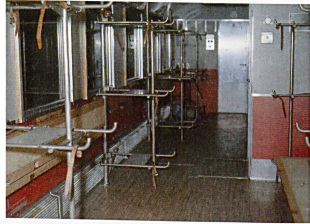
Bild unten Innenansicht eines Krankenwagens