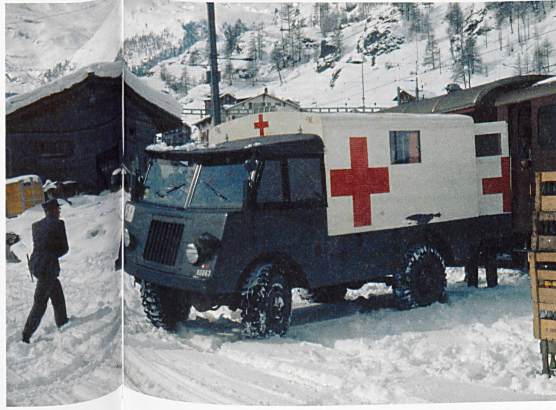
Verladen der Patienten vom Militär

Bereits bei der Ankunft in Zermatt werden die Wehrmänner mit dem Ernstfall konfrontiert: «Auf dem anderen Geleise stand ein Zug der Visp-Zermatt-Bahn. Bei minus zwei Grad lagen in den Gepäckwagen zwölf Typhuspatienten auf Tragbahnen. Sie sollten in Visp auf den Zug der SBB umgeladen und ins Kantonsspital Lausanne gebracht werden. Der Rotkreuzarzt und die beiden Rotkreuzhelfer, die sie begleiteten, baten das Sanitätsdetachment dringend um