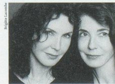
Katia und Marielle Labèque

A8 MITTWOCH, 4. JUNI 2014 B6 DONNERSTAG, 5. JUNI 2014