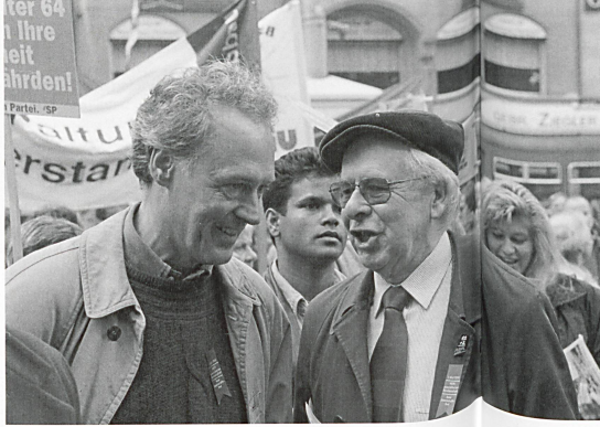
Parteirossen der dritten und vierten Generation