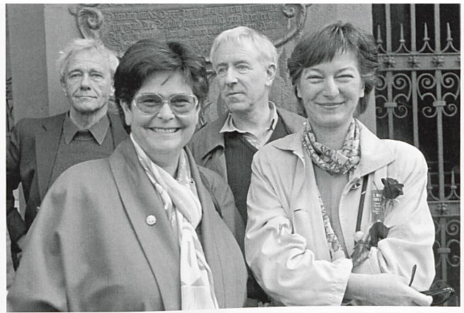
Bild oben 1997: Ruth Dreifuss, Bundesrätin, und Veronika Schaller, Regierungsrätin BS

Der Landesstreik führte die Schweiz an den Rand eines Bürgerkrieges. Der Bundesrat mobilisierte die Armee. In Grenchen wurden drei Streikende erschossen. In den grösseren Städten bildeten sich Bürgerwehren «zur Aufrechterhaltung der verfassungsmässigen Sicherheit, Ruhe und Ordnung». Am 13. November 1918 forderte der Bundesrat, der sämtliche bürgerlichen Parlamentarier hinter sich wusste, das «Oltener Aktionskomitee» ultimativ auf, die Kampfmassnahmen abzubrechen. Die Streikführung, die eine blutige Niederschlagung durch die Armee nicht riskieren wollte, kapitulierte. Friedrich Schneider