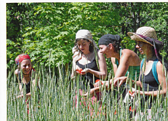
Kooperative in Briançon weiterverarbeitet werden. Man verfügt sogar über eine eigene Radiostation.

[wr] Nach Nordwesten begrenzt das Hochland von Vaucluse, nach Norden die Montagne de Lure den weiten Horizont. Jetzt im April ist ihre sanfte Kuppe noch schneebedeckt. Ein lichtdurchfluteter Himmel spannt sich über die Hügel der Provence. Einer davon, unweit von Limans bei Forcalquier, gehört der Kooperative Longo maï.