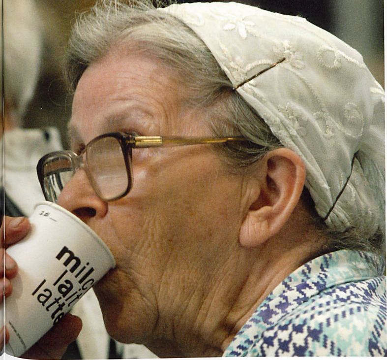
Milch: ein klassisches Genossenschaftsprodukt

ten können sich den aktuellen Wirtschaftstrends nicht entziehen, wenn sie in den sich permanent wandelnden Märkten bestehen wollen. Auch wenn der Rendite- und Stabilitätsdruck nicht derart gross ist wie bei einer Aktiengesellschaft, so sind Zusammenschlüsse und Zukäufe zu grösseren schlagkräftigen Einheiten unabdingbar. Innovationen gehören heute zu einer erfolgreichen Genossenschaft wie der traditionelle Anteilschein. Die Schweizer Reisekasse (REKA) oder das Carsharing-Unternehmen Mobility sind, was Informationstechnik und modernste Marketingtools angeht, auf der Höhe der Zeit. Der Markt dankt es mit Wachstum. REKA steigerte den Umsatz in zehn Jahren um 70 Prozent. Mobility wächst noch schneller. Gerade in den Krisenjahren hat es sich gezeigt, dass Unternehmenswerte wie Nachhaltigkeit und Kundennutzen wieder wichtiger werden. Viele Genos-