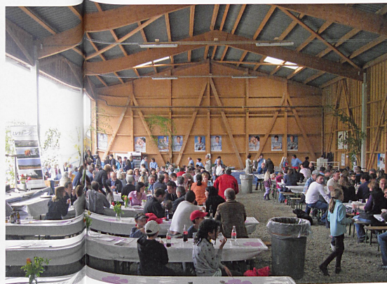
Bild oben Fest in der Halle der Maschinengemeinschaft