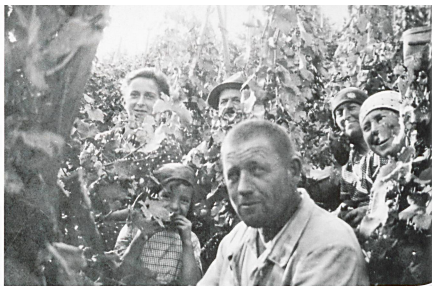
Traubenernte anno dazumal