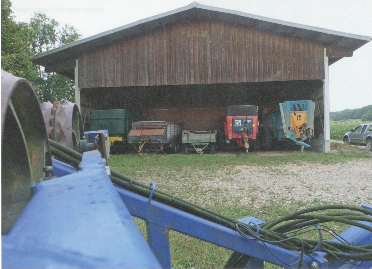
Bild links Halle der Maschinen- gemeinschaft