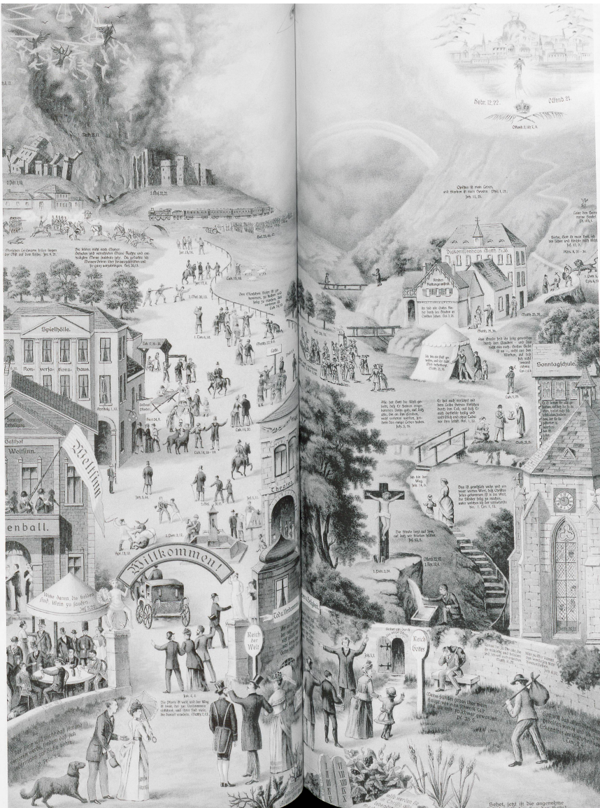
Der breite Weg zur Höhle und der schmale Pfad ins Himmelreich

Der Pietismus strebte innerhalb der protestantischen Kirche eine moralische Erneuerung an. Er stand der theologischen Wissenschaft kritisch gegenüber und kann insofern als «moderne» Bewegung betrachtet werden, als in seinem Zentrum das Individuum, das «fromme Subjekt» steht, dessen Glaube durch das Wirken Gottes, durch eine Art Wiedergeburt des Lebens zu neuer Frömmigkeit «erweckt» wird. Die Pietisten orientierten sich an einem praktischen Christentum, aus dem zahlreiche soziale und kirchliche Einrichtungen, sogenannte Reichgotteswerke, hervorgehen sollten. Sie beriefen sich in ihrer Lebensführung allein auf die Bibel. Um sich ihres Glaubens zu versichern, trafen sie sich in urchristlicher Tradition in privaten Hauskreisen, sogenannten Konventikeln, und vertraten die Ansicht, ein Laie könne die Schrift ebenso auslegen wie ein Theologe. Radikalpietisten, deren Positionen sich kaum von jenen der verfolgten Täufergemeinden unterschieden, verweigerten deshalb den Predigtbesuch und die gemeinsame Abend-