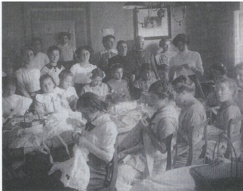
Frauenförderung um 1900: Nähstube der GGG

ter die Offiziersgesellschaft Basel-Stadt hervorgehen sollte, wurde in jener Zeit des Umbruchs gegründet. Solche Vereinigungen waren grundsätzlich offen für jedermann, der in der Lage war, die Mitgliederbeiträge zu bezahlen. Ausser für Frauen natürlich. Letztlich also doch eher für eine Elite, eine durch die Gnade der Geburt bevorzugte und vom Geist der Veränderung bewegte Gruppe.