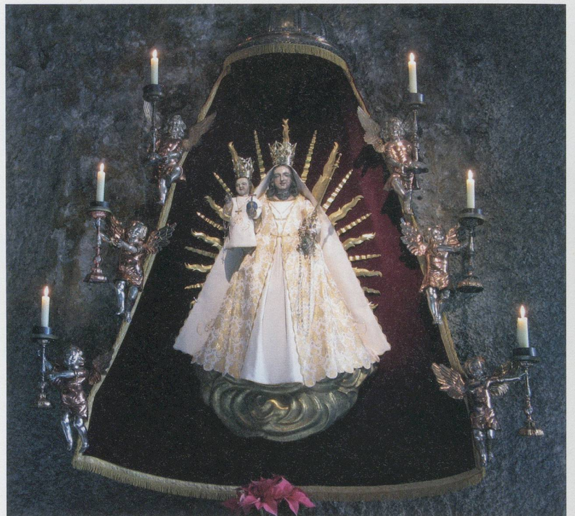
Maria im Stein

Für Angehörige von Migrationsgemeinden ist die Wallfahrt nach Mariastein, die ihre Priester jährlich einmal für sie organisieren, nicht nur von spiritueller, sondern auch von sozialer Bedeutung. Im Anschluss an die Messe, die in ihrer Sprache gelesen