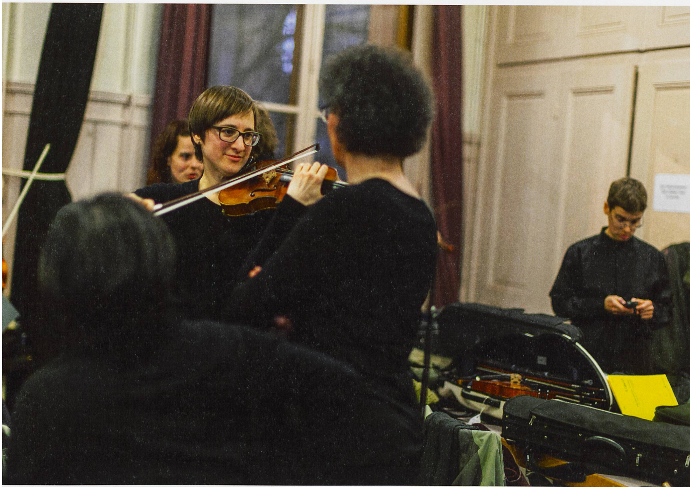
Vor dem Auftritt