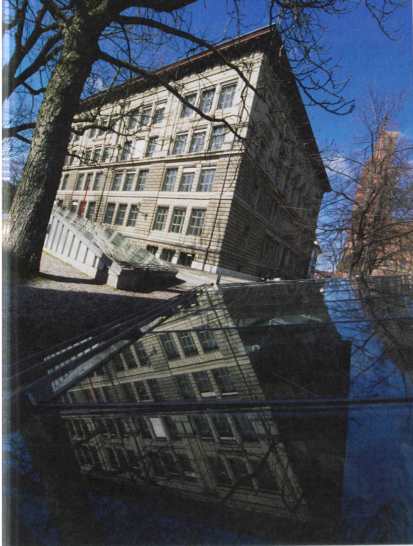
◀ Infostelle beim ehemaligen Schulhaus an der Rittergasse

jenem Gebiet aufgrund der Bodenbeschaffenheit gar keinen Wald, sondern eher eine Buschlandschaft. Dies, wenn sich der Schotter relativ nah unter der Oberfläche befand, sodass es zu wenig Humus gab. Diese Frage müsste ein Paläo-Botaniker beantworten.