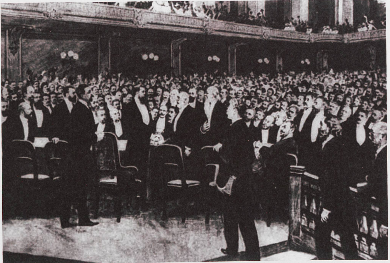
Zionistenkongress 1897 in Basel

In Wien, wo er lebte, haben ihn manche als Spinner empfunden. Tatsächlich war er ein Visionär, der lange vor der Gründung Israels von einem Judenstaat träumte. Wer in dreissig Jahren Recht behalten wolle, notierte Theodor Herzl in sein Tagebuch, müsse zunächst für verrückt erklärt werden.