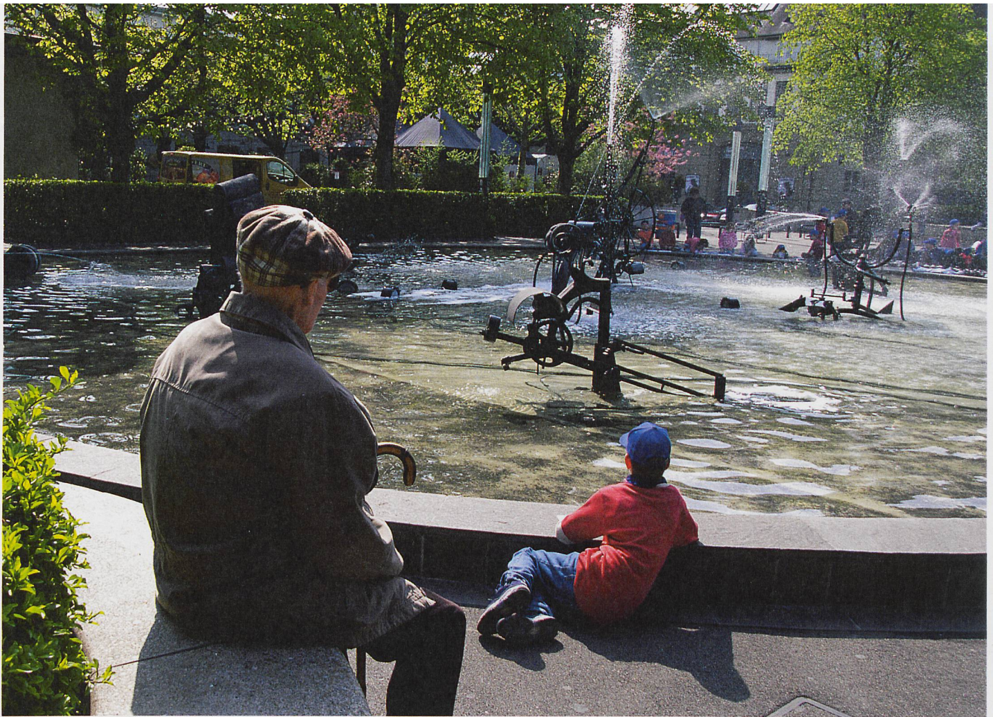
Am Tinguely Brunnen

Der Brunnen wird alle zwei Wochen geputzt, dazu wird morgens das Wasser abgelassen. Bis er wieder gefüllt ist, dauert es bis Mittag. Für den Unterhalt seines Werkes müssen zusätzliche personelle Ressourcen eingesetzt werden. Neben den Lohnkosten fallen Ausgaben für Material, Strom und Frischwasser an. Alles in allem lässt sich der Staat das Kunstwerk jährlich zwischen 50000 und 60000 Franken kosten. Das ist nicht viel für ein Wasserspiel, das inzwischen zu einem Wahrzeichen der Stadt geworden ist.