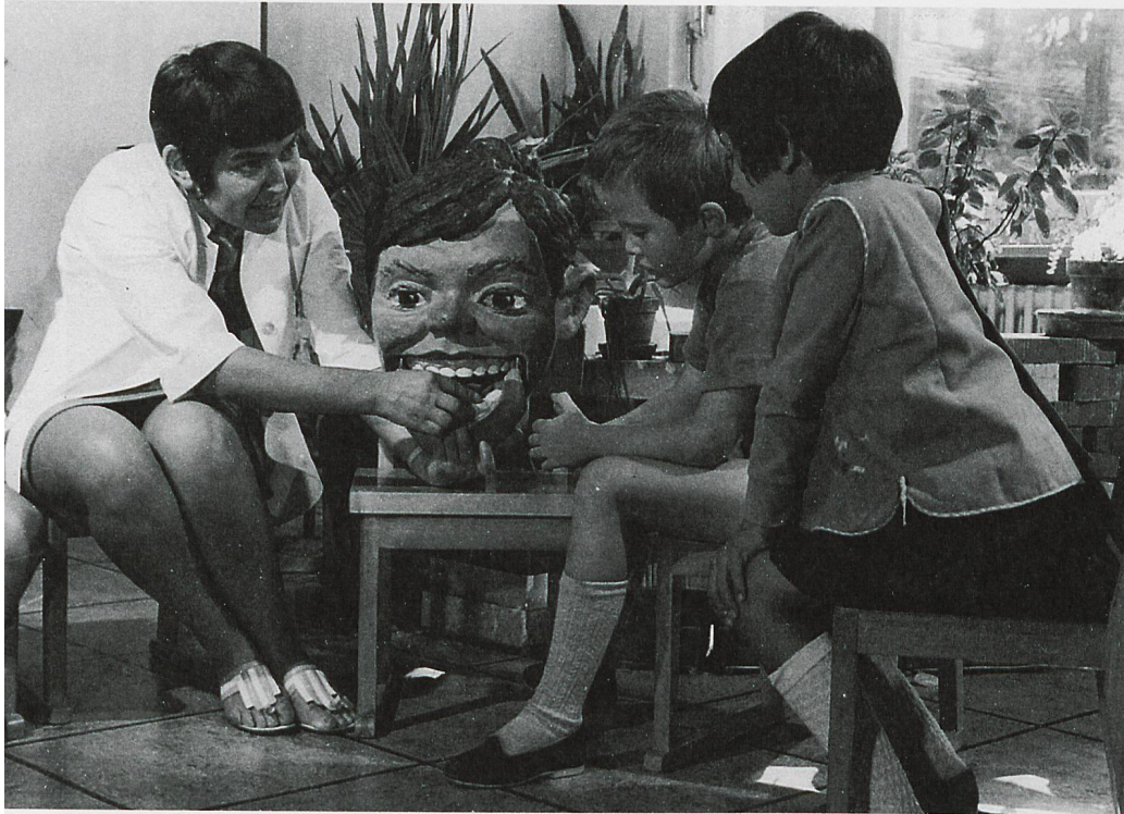
Schulzahnpflege in den 1960/70er-Jahren

Sie standen unter der Aufsicht einer älteren Ärztin, die seit Jahr und Tag ihrem freudlosen Gewerbe nachging. Aber nicht nur sie kannte ihre Untergebenen – auch im Warteraum wurden die auszubildenden Mitarbeiterinnen durch die Kinder eingeschätzt, benannt und qualifiziert.