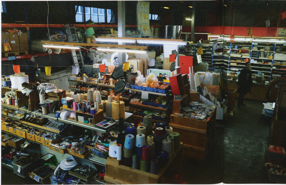
Der gut sortierte Materialmarkt auf dem Dreispitz