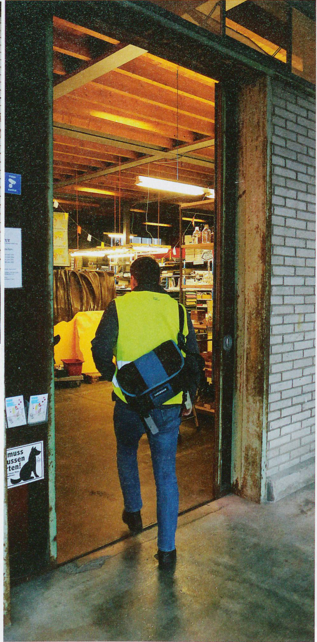
Der Materialmarkt in Basel hat sich gut etabliert.